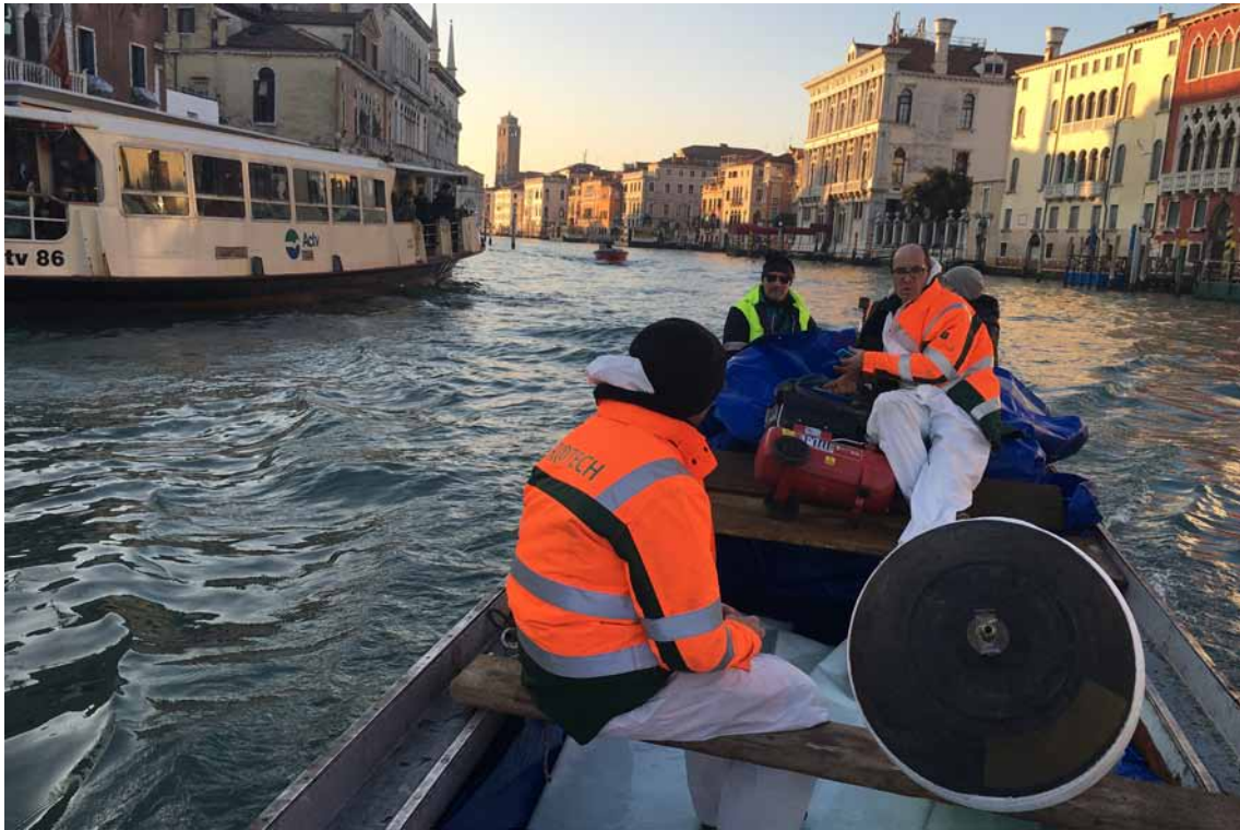
Außergewöhnlicher Anfahrtsweg: Den malerischen Weg zwischen Tränkungswerk und Einbaustelle legte der BlueLiner auf dem Canal Grande mit dem Boot zurück.